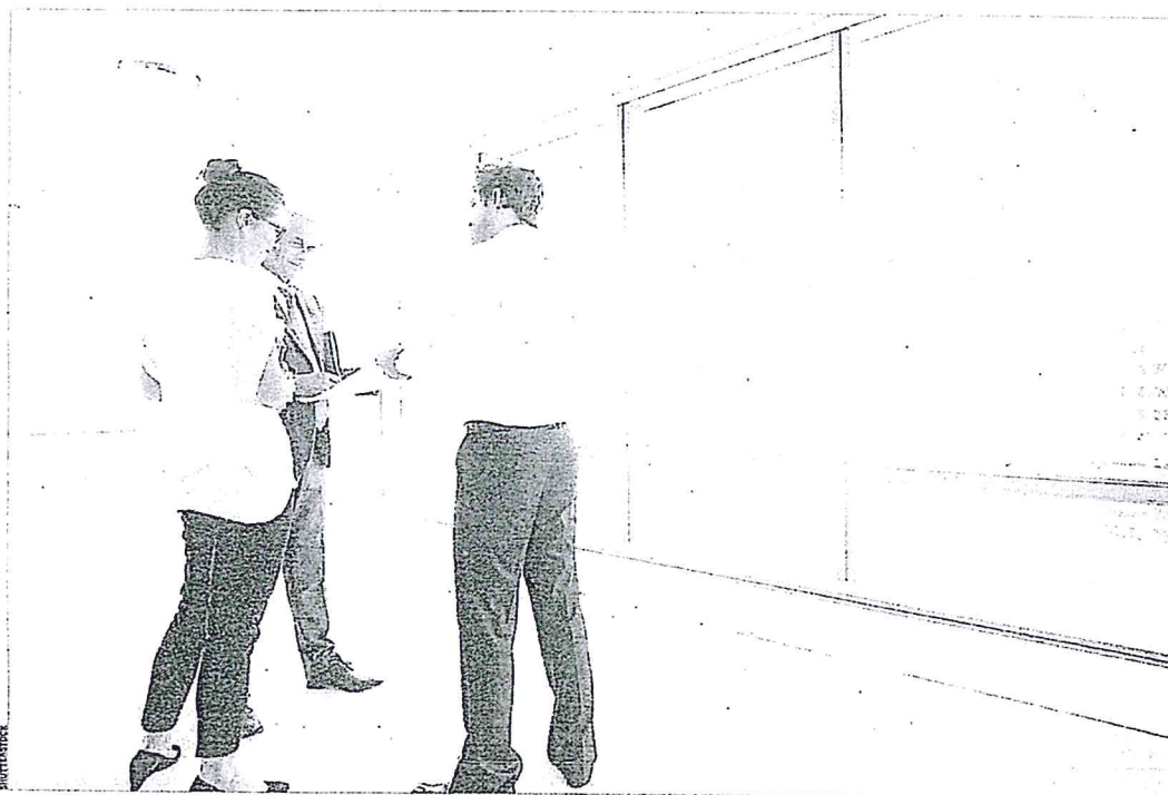
Rzeczoznawca majątkowy wycenia obiekt, zanim bank zdecyduje się sfinansować zakup, remont lub przebudowę

✉ masz pytanie, wyślij e-mail do autorki: anna.krzyzanowska@rp.pl